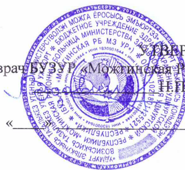
ГРАФИК выездов специалистов БУЗ УР «Можгинская РБ МЗ УР» для осмотра взрослого населения (мобильный диагностический комплекс) декабрь 2019 года